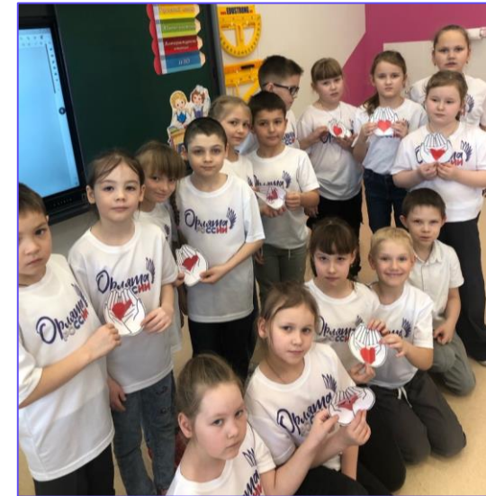
Обучающиеся 3-го «в» класса МАОУ СШ 3